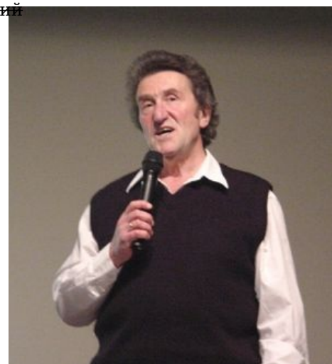
Губерман невозбранно стихоплётствует

Игорь Миронович Губерман (ивр. יְהוּדָה בֶּן מֵאִיר גּוֹבֵרמָן ) — ЕРЖ, советский антисоветский поэт, прозаик и диссидент. Даже не совсем поэт, а скорее таки бард. Знаменит своими четверо (а также дву-, шести- и далее как повезет) стишиями — «гариками» [1] .