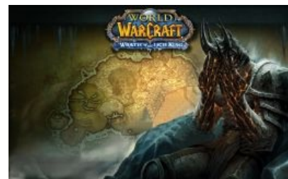
Болвару стыдно за тебя.

https://www.youtube.com/watch?v=HtvYRrgZ04 50 dkp minus