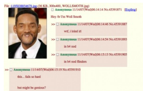
Первое появление сабжа в /b/