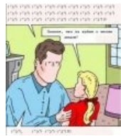
Джөрдж Бөш Горри Пөттөр Ющонко Пиктограмма