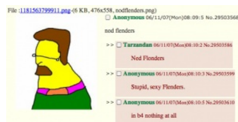
Первое появление Nod Flenders