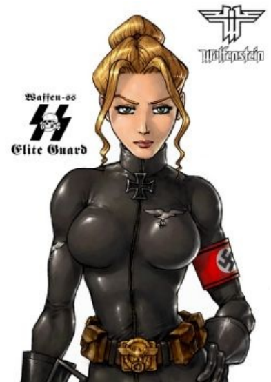
Гламурный фашизм такой гламурный

Создатель новой серии эпической игры — студия MachineGames — настоятельно рекомендует олдфагам обновить своё ржавое железо к 20.05.2014!