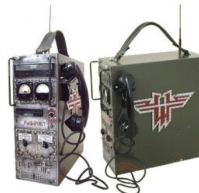
Мечта любого вольфофага