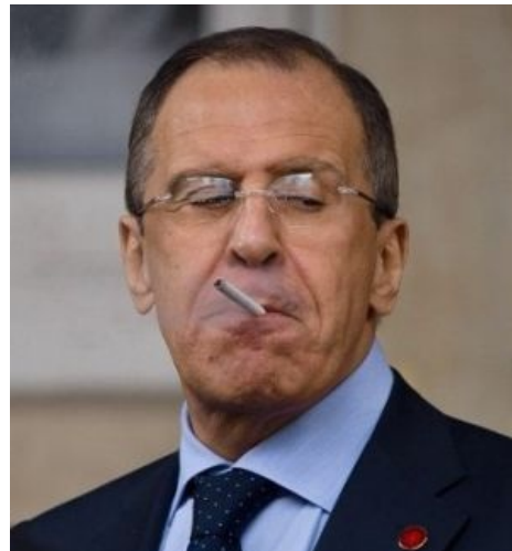
Как на говно.

Внимание! Это статья про нечто, имеющее отношение к политике. Она, вне всякого сомнения, заангажирована в чью-то пользу. Nobody cares.