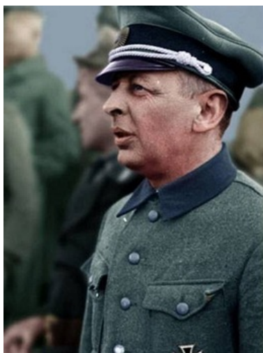
Каминский даже не смотрит на тебя

были подброшены немцам после серии неудачных покушений на него.