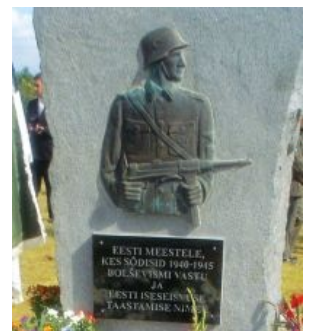
Они сражались за родину