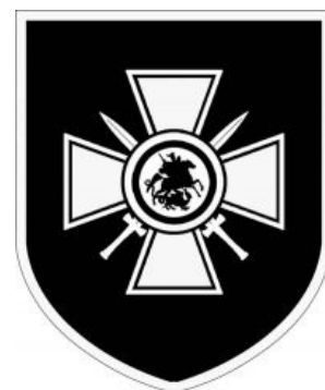
Георгиевский крест — эмблема РОНА. Ленточки негодуэ

Разумеется, главной идеей для них было скорее «домой, в рейх», нежели бандеровская «самостийность» — они таки австрийские славяне, а не хохлацкие унтерменши, Галиция цэ Европа . Обе команды спецолимпиады пытаются игнорировать это обстоятельство в попытках объединить их с бандеровцами: хохлы пытаются отмыть «Галицию», чтобы раздуть масштабы бандеровщины и отмазаться от участия в Холокосте и прочих нечеловеколюбивых деяниях, а москали радостно с ними соглашаются, пытаясь навесить на Бандеру чужие грехи и утопить его в коричневом . На выходе — лулзы и море еды, так как те и другие в равной степени путаются в показаниях.