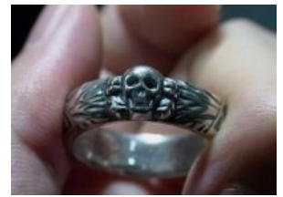
Nine for Mortal Men doomed to die...

Также череп и кости в обеих петлицах носили танкисты Вермахта, но у них они немного отличались. Вообще, эта символика ещё со времён Первой Мировой войны принадлежала Панцерваффе. В начале войны на Востоке, когда красные еще не разбирались в тонкостях, череп с костями, а также черная форма танкистов периодически наталкивали на мысль не морочиться с их взятием в плен.