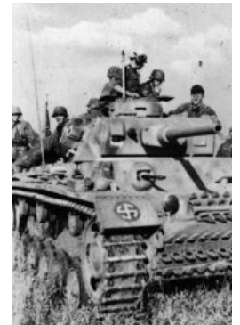
Танчик дивизии «Викинг»

С самого начала боевых действий в Европе немцы столкнулись не только с партизанским сопротивлением, но также и с поддержкой действий своих войск на захваченных территориях. Этому были три причины: во-первых, сепаратизм мелких государств и территорий, которые поддерживали Германию в обмен на обещание независимости, во-вторых — страх перед возможной оккупацией государства