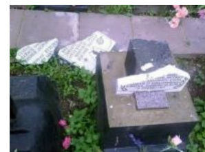
Осколки былинной казачьей славы

Доставляет, что при всём негативе по отношению к СС в этой стране, репутацию казачков-эсэсовцев периодически таки пытаются отмыть. В 1997 году дело дошло аж до Верховного суда, однако ж, не получилось, не фартануло — казачьих лидеры на немецкой службе были признаны «обоснованно осуждёнными и не подлежащими реабилитации». Тем не менее, ещё в 1992 в их честь в самом ДС (sic!) был установлен мемориал, простоявший целых 15 лет, покуда не был выпилен неизвестным гражданином с активной гражданской позицией .