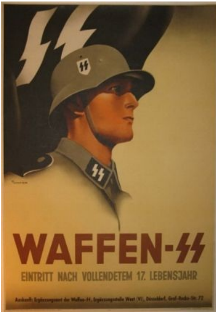
Известный плакат Waffen-SS

службу во французский Иностраный легион, где успели тряхнуть стариной в битве при Дьенбьенфу [11] , и в Палестину, где таки смогли повоевать с сионистами.