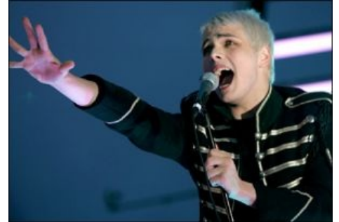
Тот самый Джерард Уэй.

Кстати, теперь при попытке отправить картинку с текстом WHEN I WAS ничего не получается: выводится ошибка. Но если заменить английскую букву e на русскую e то... она спокойно проходит