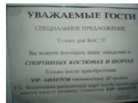
Спецпредложение для особо важных персон.

План промо-вечеринки для VIP по версии школоты.