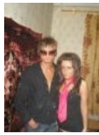
Ковер на фоне пациентов и совковых занавесок