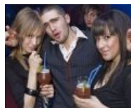
Типичный VIP-самец с кавказа в окружении гламурных кисо