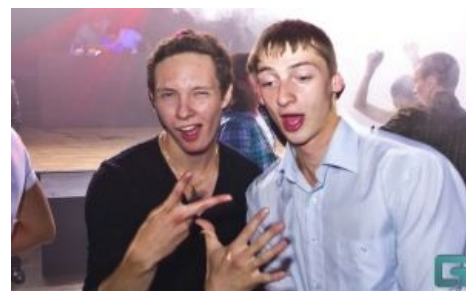
Ну кто скажет шо не VIP? Распальцовка докажет

VIP-мания в интернетах появилась вследствие ловкого хода вконтактных спамеров , знающих все о человеческой психологии — особо озабоченным своим социальным статусом пользователям предлагали модифицировать аккаунт (добавление новых функций,