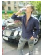
Яркий тусовщик (Original boy). Живу в образе "Золотого мальчика" ("Golden rain"), внешне и внутренне полностью соответствую...