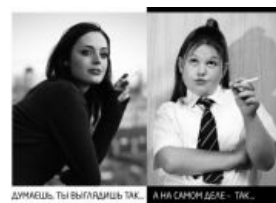
Сэд бат тру...

Вторым этапом стало появление специальных сайтов, на которых за довольно внушительные для такой