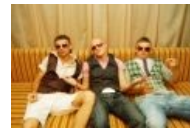
Пластмассовые быдлорожи посещают очередную быдлоклуб в вечер пятницо