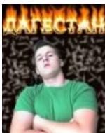
Типичный VIP-самец с кавказа сумел прикрутить к фотешопу фильтр «огненный текст», что и поспешил нам продемонстрировать.