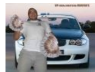
Терминальная стадия VIP у поциента. Алсо: невооруженным глазом видна низкокачественная фотожаба .