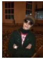
Типичный провинциальный быдломажор в вакууме