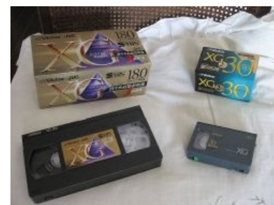
Кассеты VHS, S-VHS и S-VHS-C

Срач VHS vs. Betamax/Betacam — это типа как Blu-Ray vs. HD DVD, но Betamax был чутка получше. Есть мнение , что победа VHS над «Бетамаксом» была обеспечена выбором производителей прона — владельцы и распространители «Бетамакса» сделали ужасную ошибку, разругавшись с порнушниками. По другой версии, VHS-кассеты победили благодаря большей продолжительности записи на них.