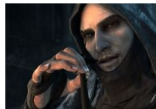
Нельзя просто взять и спиздить Primal stone