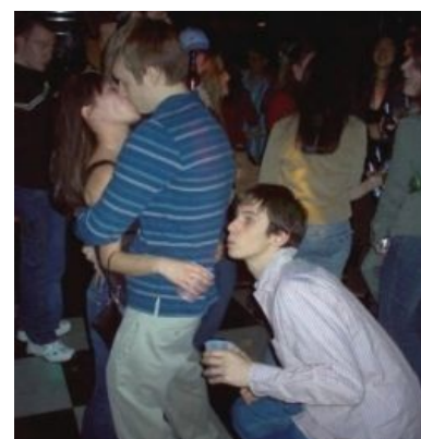
Thief-нуб, в инвентаре пока только пластиковый стакан с пивом.