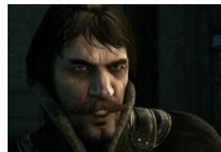
Вот, Петька, переловим всех белых, и заживём!

Нельзя просто взять и спиздить Primal stone