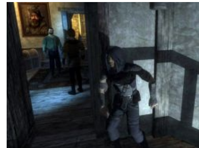
Тот самый разговор с псевдо-Гарретом

Местный мунспик — викторианская речь религиозных фанатов (в третьей части выпилена на 95%), деревенский говор язычников (допилен только в третью часть) — крысолюды в первой и третьей частях, куршоки и статуи в третьей — все они невозбранно потешают англоговорящего игрока. Любителей Страны восходящего солнца порадуют глифы Кеерер'ов — хрен поймешь, что они обозначают, но выглядит весьма достоверно. Универсальное слово «таффер» может означать как ругательство (Ye' taffing me! I see you, taffer!), так и похвалу. Придуманно ЛГ-дизайнером Лорой Болдвин, по ее словам, означает человека или нечто, что ТАФФАЕТ. Ну ты понел.