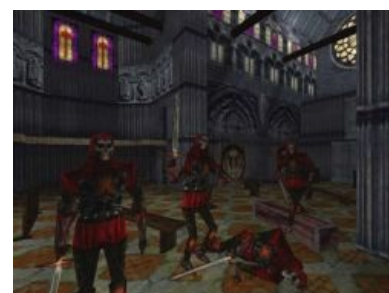
Haunted Cathedral is so haunted

Короче говоря, УХ! Если слова Haunted Cathedral и Bonehoard вам ничего не говорят, то вы ничего не понимаете в Thief.