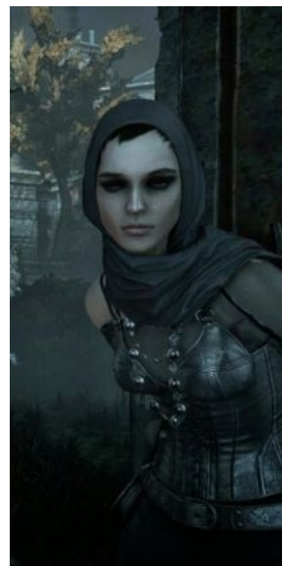
Вот на это в игре

Вот, Петька, переловим всех белых, и заживём!