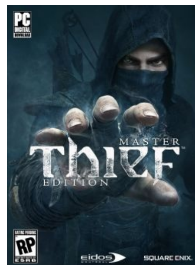
Гарретт спиздит у тебя эти буквы и ты не заметишь

Лучше бы его не было. Аналог чутья/концентрации из Hitman и Splinter Cell. Подсвечивает лут, замедляет