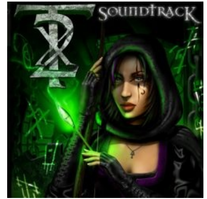
Зауа такая зая.

После того, как случайно нашли исходный код первых двух «Воров», в сообществе пробежала небольшая драма, суть которой в трех словах такова: «Отдайте код, суки!» Собственно, исходники просили и раньше (даже петицию накатали), но где-то в начале 2010 года один бывший разработчик из LGS нашел и передал Eidos'у полный исходный код Dark Engine, и тот долго думал — давать фанатам или не давать. Пока юридический отдел издателя рожал, код все-таки утёк наружу (но не полностью и не оттуда, кое-чего не хватает), часть коммунити орать перестала и разом ушла в подполье перепиливать бажный экземпляр движка. Что у них там под покровом ночи творится, неизвестно, однако обещаются разные ништяки, вроде отказа от искусственных ограничений движка, включение труп-динамических теней, широкая поддержка модов и настоящий DirectX.