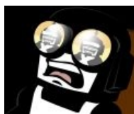
Стив срёт кирпичами