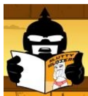
Будни рядового Скиттлса