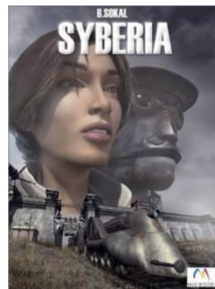
Кейт и Бендер Оскар.

Syberia ( Сайберия, Суберия , рас. Сибирия , надм. Сибирь ) — компьютерный квест типа «адвенчура», исполненный в псевдо-3Д и выпущенный в свет в 2002 году конторкой Microïds под руководством расового француза бельгийца Бенуа Сокала (по совместительству рисовальщика комиксов). Является достаточно простосюжетной игрой по принципу "тычь мышью что попало куда попало, и наравне мозгами — авось что из этого выйдет", проще говоря point'n'click , и в принципе, если бы не присутствие фапабельной тян в главной роли, уже давно бы скатившейся в /pkunzip . Хотя по слухам, тучи анонов схавали куш чисто за счёт вопиющей стимпанк -стилистики среди игр, с вопиющими той блекджеком и железными человеками.