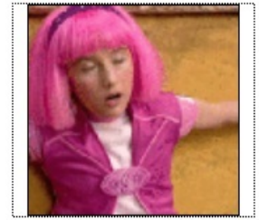
МОЛОДЕНЬКИЕ ДАЮТ ВЗРОСЛЫМ ДЯДЯМ