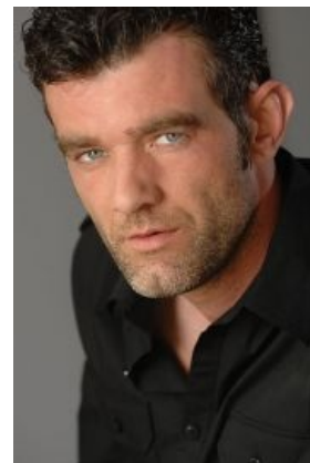
А на самом деле он брутален