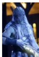
А это их солдат.