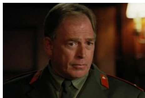
Полковник Чехов Чеков неодобряэ

Изначально про врата знали только они. Но не США единым: в SG-1 есть таки мы. Мы ездим на чехословацких джипах, используем югославские Заставы М-85 [2] , мы фейлим со своей собственной программой Звёздных врат, мы косолапы, некомпетентны и ставим под угрозу всю Землю, что тут же фиксится ими, не потерявшими ни одного своего и угробив целый взвод нас. А если напорчат они, то мы не помогаем им безвозмездно, а требуем взамен делиться инопланетными ништяками, добытыми кровью и потом доблестного американского солдата. Наши подводные лодки с перепутанной kirilitsa захватываются инопланетянами, а затем уничтожаются ими, но они нам об этом не рассказывают. Наши начальники штабов толстозады, ленивы, жадны, глупы и кровожадны, а наша кровавая гебня способна переманить к себе американского полковника-бюрократа. Но та же кровавая гебня не способна уследить за собственным министром обороны, который под инопланетным влиянием хочет развязать третью мировую с США. Но всё-таки без нас никуда, потому что именно мы множество раз спасали бесценный SG-1, забирая на себя всевозможные лазеры, предназначенные им.