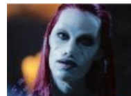
А это королева рейфов. Ня!