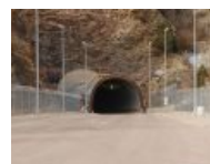
Здесь , глубоко под землёй, находятся врата Земли.