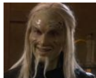
А это рейф.