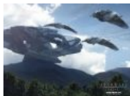
Ха'так, космический корабль гоа'улдов.