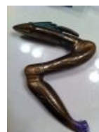
Зат'Ник'Тэл, короткоствол гоа'улдов.