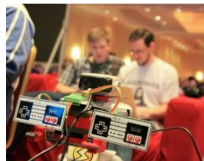
С чего всё началось