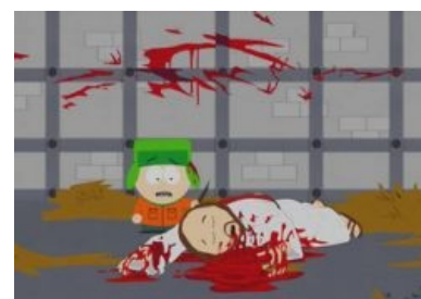
«Кайл, что я говорил тебе насчет убийства Иисуса?»