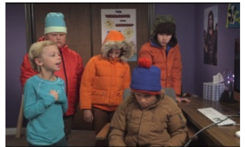
И даже Баттерс