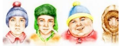
Вот эти ребята

Легендарнейший тролль, лжец, предположительно девственник и единственный, кого эти характеристики, в принципе, не способны унижить, ибо «Вы, парни, валите на хуй, а я домой!». Имя —