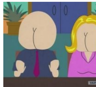
Синдром телесной полярности (повсеместно распространён в интернете)