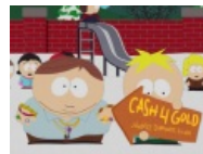
Картман организовал ломбард, а Баттерс как всегда