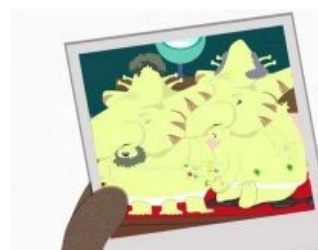
Сосёт джагон и суёт палец в шрушер