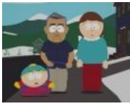
Картман на прогулке с собачьим психологом