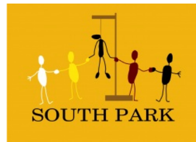
Флаг SP. Версия 2.0

Изменившийся с 18 сезона формат шоу на «один сезон — одна сюжетная линия» и изменение характеров персонажей во имя сиюминутных сюжетных нужд в лучших традициях Симпсонов также вызвало волну критики со стороны многих староёбов, хотя, после 20-го сезона ещё успели выстрелить, ибо были посвящены глупости над особо актуальными нынче темами вроде SJW и цензуре под видом заботы о стране и народе. По факту смены концепции ведутся срачи на тему «ТМ: устаревшие исписавшиеся мудаки или острые сатирики современности?»