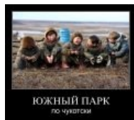
Южная парка, однако!