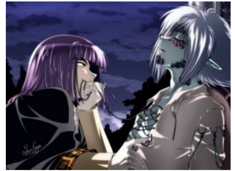
Слева — Зеллос. Справа — Зелгадис. Nuff said