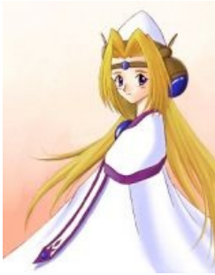
Филия такая чепуха