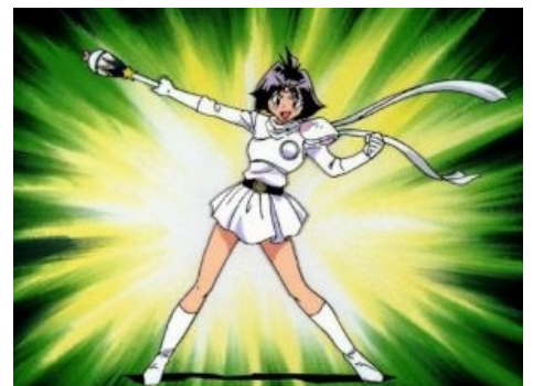
Во имя луны и справедливости!