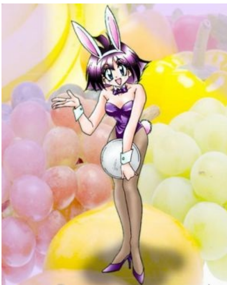
Амелия обслуживает фонатов.