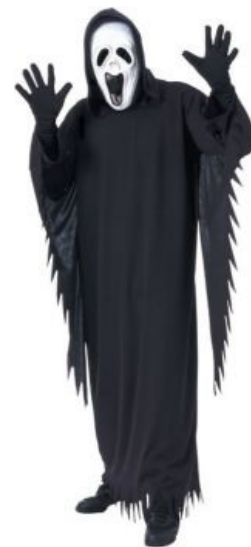
Посоны, не бойтесь, я сегодня в хорошем настроении

По своей структуре «Крик», на первый взгляд, как и пародируемые им фильмы, является типичным ужасиком без особых изысков. Тем не менее, он не канул в Лету с течением времени, как, например, «Я знаю, что вы сделали прошлым летом» [1] , и тому есть причины: