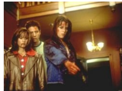
GAME OVER: Goodnight, sweet maniac

в фильмах ужасов всегда так! Каждый фильм заканчивается феерическим срывом покровов с убийцы (причём делается это всегда добровольно с его стороны), получасовым монологом маньяка и финал баттлом с Сидни. Для убийцы, естественно, всё заканчивается эпик фэйлом . ВНЕЗАПНО оживший на последних секундах маньяк и его эффектное добивание прилагаются.