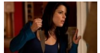
«Крик 4». Сидни всё ещё торт