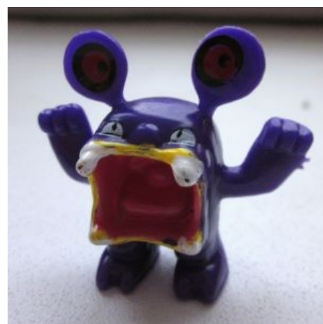
Эти ваши покемоны

Ближайшие родственники «Shoop da whoop» в русском языке: хуяк,