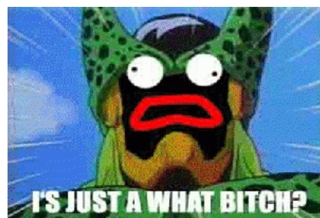
Shoop da whoop!