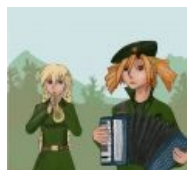
Бесконечное лето In the grim darkness of far future