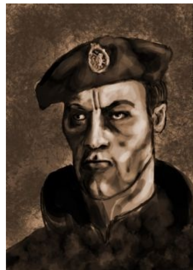
Его еще и рисуют

Всемирную известность солдатскому ансамблю принес ролик «RAMBO SERBIA», появившийся в 2010 году и содержащий довольно заводную мелодию Balkan Beat — Serbian Mix (оно же DJ Zeki — Club Wedding (Serbian Remix) ). Особое внимание привлекло описание к видео, где автор посылал лютые лучи обожания врагам народа и их неполноценной расе: