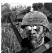
Born to REMOVE