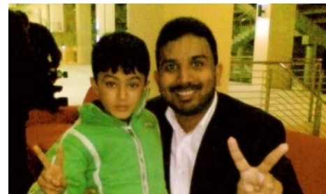
Патман смотрит на тебя, как на начинающего бизнесмена

«Непреодолимая причина». У большинства адептов мечта — квартира, машина, куча бабла. Более расширенная формулировка — то, ради чего ты готов на всё. Основной мотиватор в данном бизнесе. И тому подобное. Патман в течение 20 минут разжевывает слово «мечта», коверкая все, что только можно. Кто вообще сказал, что мечта должна исчисляться в долларовом эквиваленте? Кто вообще сказал, что мечта должна быть осуществяляема? Замена названий таких второстепенных, таки да, жизненных задач, как квартира и машина, на слово «мечта», бьет по мозгам ослов, верящих, что занимаются бизнесом, который приведет их к сбыче мечт.