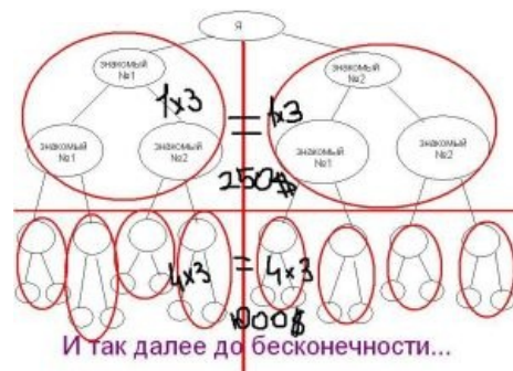
Кривоватая схемка, отражающая соль