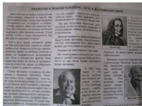
Саентологическая листовка, обратная сторона