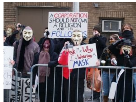
Анонимусы против мозгоебизма.

В официальном обращении церковь объявила протесты сначала проделками гиков, а позже — провокацией немецких спецслужб.