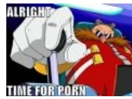
Роботник v. 2.0