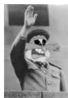
В образе Сталина