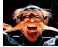
Картаус «Рыжий Ус»