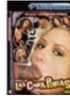
Las chupa PINGAS