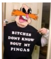
Bitches don't know!