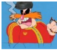
Доктор Гопотник Пиклс