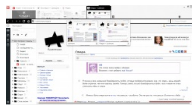
Vivaldi — реинкарнация Opera