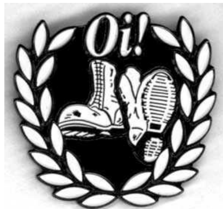
Oi! Oi! Oi!