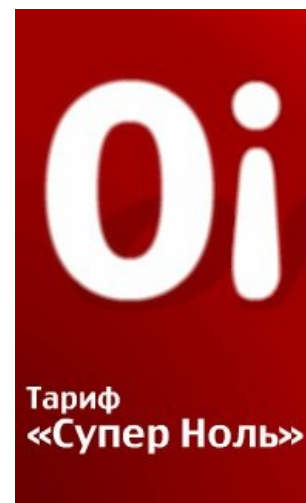
МТС тоже в теме