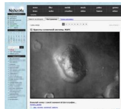
Таким был NoName до 2009 года

Назначение главной страницы Проекта точно определить не удалось. Возможно, она служила рупором идей самого разного толка , находящихся немедленный и достаточно живой отклик у завсегдатаев Проекта . При этом уровень фимозности этих идей, как правило, приводил в негодность самый стойкий ФГМометр . Конкурируя с фишками , с которыми наблюдалось взаимное воровство новостей, администраторы сайта начали размещать на главной сиськи . Однако затем выбор был сделан в пользу хохлосрача , и сиськи больше не пропускались в главный раздел.