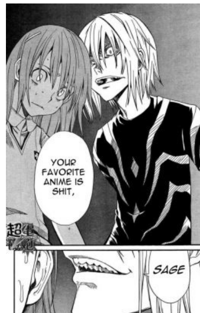
Эсперы пятого уровня