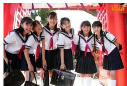
Японские школьницы смеются над тобой, потому что ты говноед.