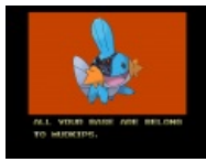
All your base are belong to mudkips.