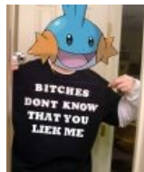
Bitches don't know.