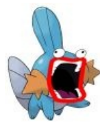
SHOOP DA WHOOP.