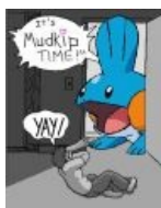
It's mudkip time