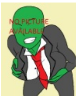
В интернетах самок нет