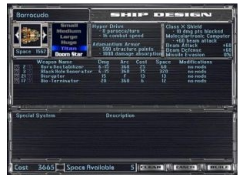
МоО2. Конструктор кораблей

Основная проблема третьей части была изложена выше. На первую и вторую тоже есть нарекания, главное из которых — небольшой размер карты. Даже на максимальном размере галактики все очень быстро вцепляются друг другу в глотку, и всякие дипломатические