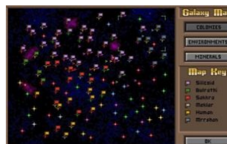
А генерал, зажавши ластик, склонился над военной картой...