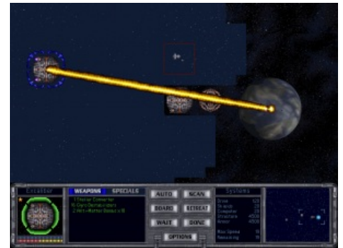
Stellar Converter. Почувствуй себя Дартом Вейдером