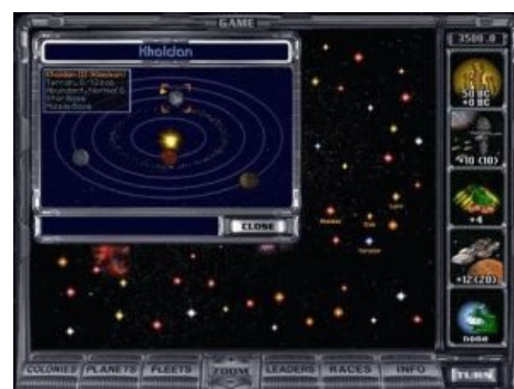
Тёплый, ламповый МоО2

Игровой процесс (мы говорим и будем говорить про первые две части) охуевающе аддиктивен. Неосторожно сев перед сном на пару ходов, можно очнуться от игры лишь от стука утренних