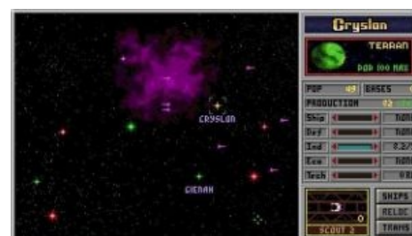
Первая часть. Играли, и добавки просили