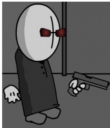
Один из вариантов элитника, в чёрно-красных очках.