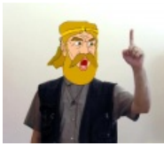
MITHGOL MAH BOOOI