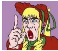
SHINKU, MAH GQRL!