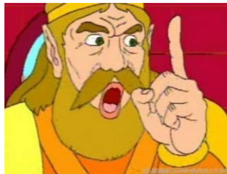
LINK МАН БОИИИ

МАН БОИ — мем 4chan и YouTube . Часть фразы «МАН БОИ, this peace is what all true warriors strive for!», которую произносит король Харкинян , классический персонаж YouTube Poop . Помимо МАН БОИ в играх про Линка для CD-i есть ещё много « волшебных » фраз и персонажей.