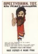
I ZHIVOTNOVODSTV MAH BOOOI!