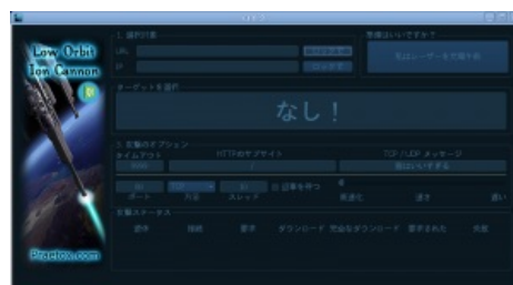
Локализация такая локализация