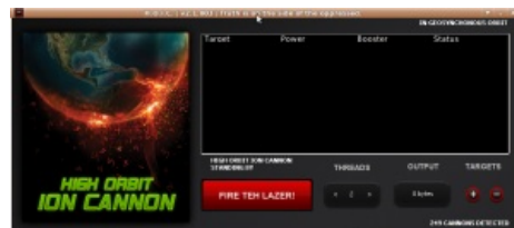
Hoic 2.1 в Ubuntu

Кстати, ПВД никогда не будет атаковать уютненькое , админы гарантируют это . Так-то!