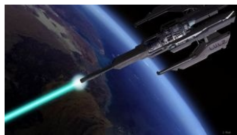
LOIC в работе

Aka High Orbit Ion Cannon. Неведомая ёбаная хуйня, появившаяся в декабре 2010. Позлее LOIC`а, позволяет бомбардировать одновременно до 256 сайтов. В отличие от предшественницы, которая закидывает цель мусорными пакетами, HOIC использует HTTP флуд , в том числе и POST/GET запросы, заставляя сервер срать