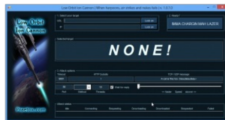
Сабж как он есть