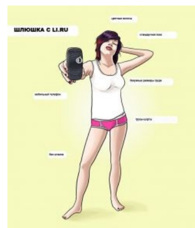
Шлюшка с ли.ру