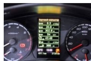
Пробег после поездки.