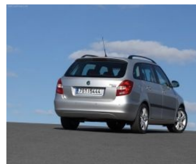
А это уже восьмилетней несвежести. Тоже VW.