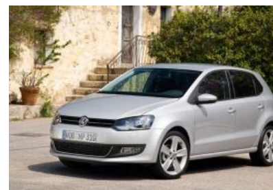
Боян пятилетней несвежести производства VW.