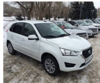
Datsun MiDo — хетчбек. На калину тоже похоже.