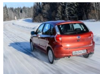
А сзади и вообще калина калиной.

Datsun MiDo — хетчбек. На калину тоже похоже.