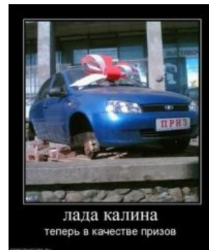
Один из демотиваторов.

В итоге получился один большой лулз. Зачастую человек, поливающий калину негативом, даже не знаком с предметом обсуждения. Более того, он даже понятия не имеет, а почему же, собственно, «калина гавно»? Некоторые жизненные ситуации очень доставляют. К примеру, PR-менеджерами Автоваза в 2006—2007 гг. был проведен опрос на улицах Нерезиновой. Москвичам демонстрировали фотографии Лады Калины без фирменного лейбла на кузове. В итоге никто из них не смог точно назвать марку автомобиля, но большинство склонялось, что это новая бюджетная модель немецкого авто. Узнав же правду, люто срвали кирпичами. Немало лулзов доставляют рассказы владельцев этого «дас ист ауто» о том, как они подвозили с работы коллегу-нищеврода. Коллега всячески расхваливал авто, а, узнав марку, высрал ведро кирпичей и испытывал когнитивный диссонанс.