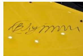
Автограф на капоте. Поцреоты фап-фап-фап.

Владимир Владимирович на Калине. Вид сбоку. Путин едет на Калине