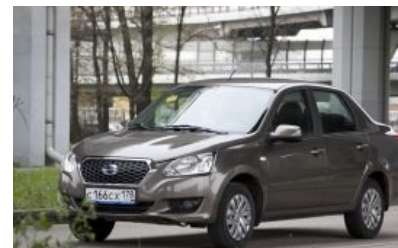
Datsun OnDo — гранта с другой мордой.