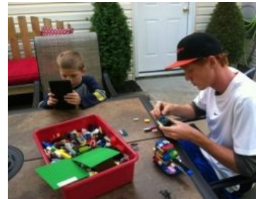
Вчерашняя школота научилась сама зарабатывать на «Лего»

Примерно к началу 2000-х конструктор стал сдавать свои позиции. Постепенно уходили в небытие универсальные детальки, из которых при наличии рук и головы можно было собрать любую модель, а взамен них стали распространяться и агрессивно пиариться по телевидению нетривиальной и сложной сборки конструкции, состоящие из уникальных деталей, практически не позволяющих их собрать по-другому; и уж тем более невозможно было сделать подобную вундервафлю из старых добрых деталек. В школьные массы толкались малопонятные сюжетные линии, которые надо было с этими игрушками отыгрывать . Надо отметить и винрарнейшую серию сначала механических, а потом и электронных лего-наборов — к машинкам прилагались и компрессоры с системой воздухопроводов, и самые натуральные электромоторы, более того, была возможность самостоятельно закупить электродеталей и подключить к ним свои старые поделки из кубиков, просранную, однако, из-за неподъемной для масс цены на нее.