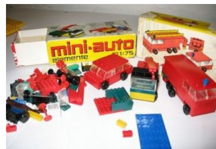
Эпичная серия rebe-mini-auto