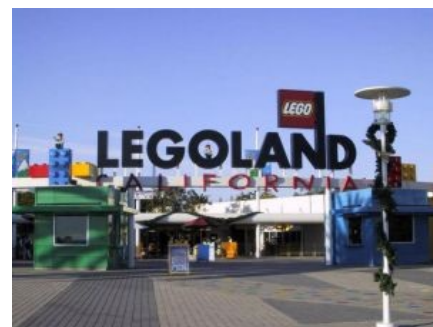
Центральный вход в леголенд, США

Warsaw Museum buys Lego Nazi concentration camp