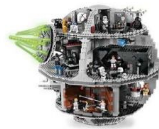
Звезда смерти из Лего

Как уже было сказано выше, основная деталь конструктора — кирпичики. Это поистине уникальная вещь, несмотря на кажущуюся простоту. Кирпичики (да и все остальные детали) изготавливаются по определенным стандартам с высокой степенью точности (штамповка в 2 микрометра). Но зачем — не оружие ведь производят? Элементарно, Ватсон: сабж рассчитан на детей с пяти лет (есть и наборы LEGO duplo, вообще, для детей с двух лет), и, следовательно, детали должны так прицепляться/отцепляться, чтобы это было под силу даже ребёнку, и в то же время держались довольно крепко и не разваливались при малейшей тряске. Так что юный спиногрыз может не только смастерить машинку, но и покатать её по квартире. Далеко не каждый китайский аналог обладает такой крепкой хваткой. Этот плюс ставится под сомнение, когда нерадивый строитель склеивает две одноразмерные тонкие пластинки, на расцепку которых уйдет не один сломанный ноготь (специальный разделитель штампуются и пощас. В стильном оранжевом цвете и штырьком для выпихивания втулок из Техник).