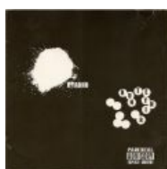
В гавно. CD version