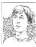
Карикатура на Блэв МС в одном из булектов альбома

Кому-то доставило «концептуальное» изображение женской писи с вкраплением чьего-то пальчика на обложке диска «5 лет» 2013-го года. Собсна, ради этого школьники и покупали последний альбом (хотя сами кантейнирцы плохо относятся к обилию школоты в своём фэндоме).