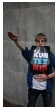
Типичный фанат кидает зигу

Кто-то нас просто слушает по приколу, по накурке, хотя попадаются и такие, кто говорит: «..., ребята, я вырос на ваших песнях». Не знаю, мне тяжело это слышать. На чем они там могли расти-то, ...? Иной раз слышу группы, которые вчистую нас копируют. И все равно это не то, не так они делают. Не то чтобы я считаю, что мы супер. Нет! Мы шняга! Но мы просто начали это делать. А сейчас это подхватили как стилистику какую-то, пытаются в дешевые микрофоны что-то гнусаить, но дальше этого сдвинуться не могут. Любой концерт покажет, на что они способны.