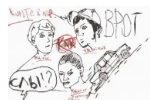
Шарж на сабж

С 2003 года пропагандировали секс, наркотики и рэп, но со временем заострили особое внимание только на втором аспекте . Процесс записи треков группы был прост как унитаз: сначала ребята что-нибудь употребляли, а затем брали дешёвый караоке-микрофон и приступали к записи. В итоге на музыку абсурда, которую заранее делал Техник, накладывался словесный понос, записанный вялым голосом и звучащий в премерзком качестве — в простонародье это называется «звук из жопы». Дёшево и сердито, но школьникам нравилось. Kunteynir и до сих пор пишет подобный бред с таким же качеством звукозаписи, и за 21 год (!) существования «музыка» группы не стала лучше ни на йоту.