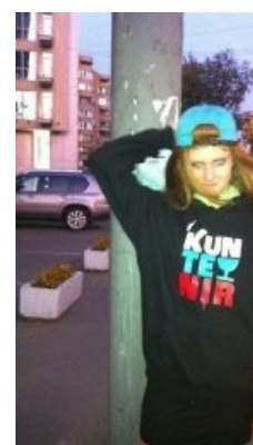
Феечки тоже без ума...