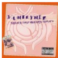
Эдвард Руки Ножницы Бумага

За что группу и можно причислить к авангарду, то это за оформление обложек их альбомов. В разное время это были, как правило, абстрактные рисунки, эскизы, карикатуры, что выделяло альбомы Контейнера среди рэп-альбомов на прилавке.