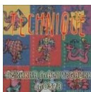
Техника мастурбации мозга