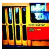
В гавно. Альтернатива