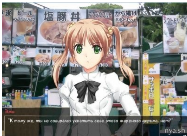
Старый скрин из первой главы хранит следы

А эта уже не комсомолка, но спортсменка еще та — при том, что она безногая , на протезах бегают так, что мама не горюй. Ноги она потеряла в автокатастрофе ( спойлер : Тогда же погиб и ее отец), но очень быстро реабилитировалась, научилась ходить на протезах и, даже не подумав унывать, вступила в беговую команду Ямаку. Надо сказать, что бегают она просто великолепно, и что бег настолько её увлекает, что в процессе она даже впадает в ту самую знаменитую зону , в которой находятся все, кто увлеченно что-то делает. Много ругается, яростно пропагандирует ЗОЖ и вообще ведет себя развязно — да, и в этом плане тоже ( спойлер : парень у нее уже был, и есть намеки, что она уже отнюдь не девственница). Вечно дуется на всех, кого хочет разжалобить — причем всегда с победным результатом.