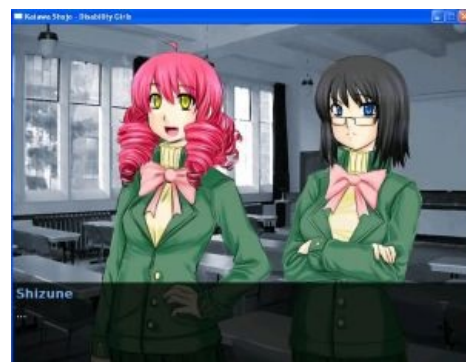
Самые ранние концепты