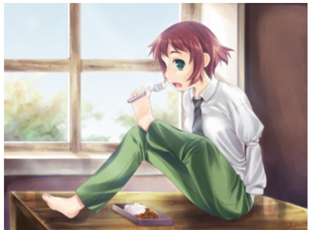
И так у нее каждый день

Самая интересная личность среди всех с арками — дверь запилить не просит, но творит чудеса похлеще . У неё отсутствуют обе руки выше локтя, причем аномалия была врожденной — так что Рин особо не заморачивается и просто делает повседневные дела ногами. Ладно бы простое выживание в повседневности, но она ещё и представлена как художница, и пишет дикие абстрактные картины в стиле то ли Гигера , то ли Мунка . Весь её креатив при общей грубости мазков нахваливают все, кому не лень — шутка ли, ногами рисовать, да еще на достойном уровне. А ещё она мечтает готовить. Помимо того, Рин — лучшая подруга Эми; последняя как раз и помогает ей одеваться по утрам.