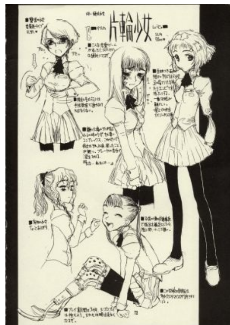
Та самая страница

Двое безработных играют в сабж (Spoiler alert)