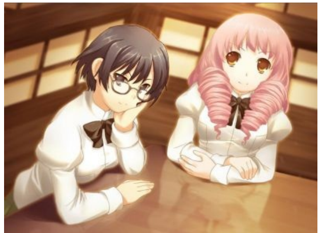
Шизуне слева, Миша справа

Шизуне — президент студсовета и вдобавок староста; уже с самой первой арки будет стремиться затащить Хисао к себе в шарашкину контору — опять-таки не без помощи подруги; почему-то во всем совете, кроме них двоих, никого и нету. Можно подивиться ее хитрым планам, а можно и возненавидеть — до тех пор, пока действие не выкатится на основную сюжетную арку и там мы не узнаем кое-что важное ( спойлер : Все, кто раньше был в совете, давно сбежали оттуда из-за диктаторских замашек Шизуне). Мегаломания и стремление всеми командовать делают очень толстую, но довольно едкую отсылку на Харухи Судзумию .