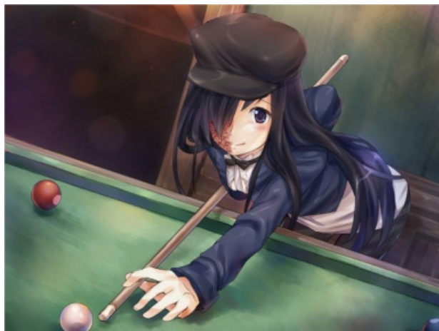
Темный угол и бильярд — вот она, радость

Обсуждения Ханako бурлят постоянно, так как она является главной любимицей анонимуса — и есть за что. Это единственный персонаж из всех показанных, с которой обращаются как с инвалидом, при том что инвалидом она не является. В целом Ханako — почти обыкновенная школьница за тем вычетом, что пол-лица и рука у нее покрыты страшными ожогами ( спойлер : искалечена вся правая половина тела), что, казалось бы, никак не роднит ее с Сандором Клиганом или с Голдотом Полумёртвым . В Ямаку же она сидит исключительно из-за тяжело травмированной психики, а также чтобы не привлекать лишнего внимания — она так боится показывать шрамы, что все остальные ее старательно в упор не замечают. Разговаривать тоже боится — только еле-еле мямлит да заикается.