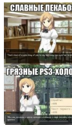
Шуточки про PC и PS3 дошли до Катавы