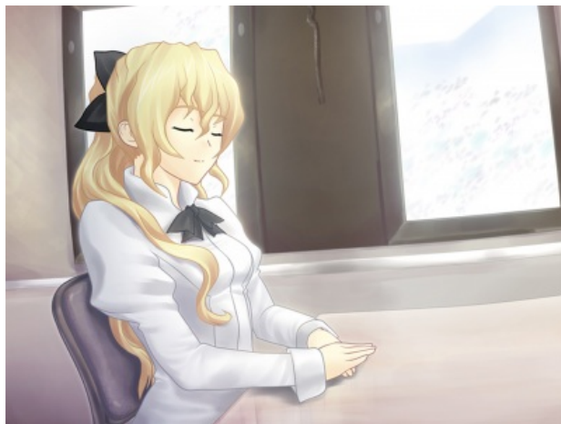
Как на плакате

Еще у Лилли есть старшая сестра — реверс-трап по имени Акира, которая для своего чопорного вида имеет довольно раздолбайский характер. Она училась в том же пансионе, но долго не продержалась . Кроме того, вся арка Лилли тесно переплетается с аркой Ханако, для которой Лилли — лучшая (и единственная) подруга, поэтому некоторые события можно встретить в разной трактовке и там, и там. Из прочих взаимоотношений следует отметить странную неприязнь между Лилли и Шизуне, которая выливается в циничные насмешки и критику со стороны Шизуне и спокойное парирование со стороны Лилли (разрыв шаблона вызывает то, что общаться друг с другом они неспособны физически; налаживать хоть какую-то связь им помогает Миша, которая таких ситуаций очень не любит и не знает, чью сторону принимать). А еще Лилли ( спойлер : быстро подсаживается на все подряд и не слезает, будь то чай, спиртное или секс).