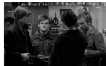
Сабж на фоне пива в фильме «Контроль». Кёртис слева

Mode а также ряда клипов других британских инди-групп Антоном Корбайном на чёрно-белую плёнку по мемуарам вдовы Кёртиса Деборы «Touching From A Distance». Многие ныне усиленно фапают на этот фильм, поскольку про Кёртиса фильмов больше как таковых нет, а тут сама жёнушка изволила запилить кинокартину!