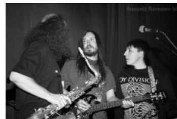
Казалось бы, причём здесь Гражданская оборона ?

Единственное, что действительно заставляет срать кирпичами фанатов Великомученика™, так это фильм о нём самом. Такой фильм есть, и называется он Контроль , снятый в 2007 режиссером большинства клипов группы Depeche