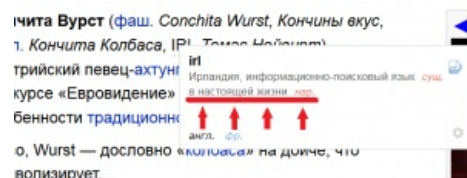
Яндекс-транслейт в курсе

Один из самых ранних примеров использования аббревиатуры RL в рунетах (в июле 1999 года текст появился на Анекдот.ру , куда пришел из эхи ru.sex.talk ; далее идёт на некий ETEL Quake WWWBoard , где датирован 28 June 1999, at 6:48 p.m.). Обратите внимание на корректное употребление термина: