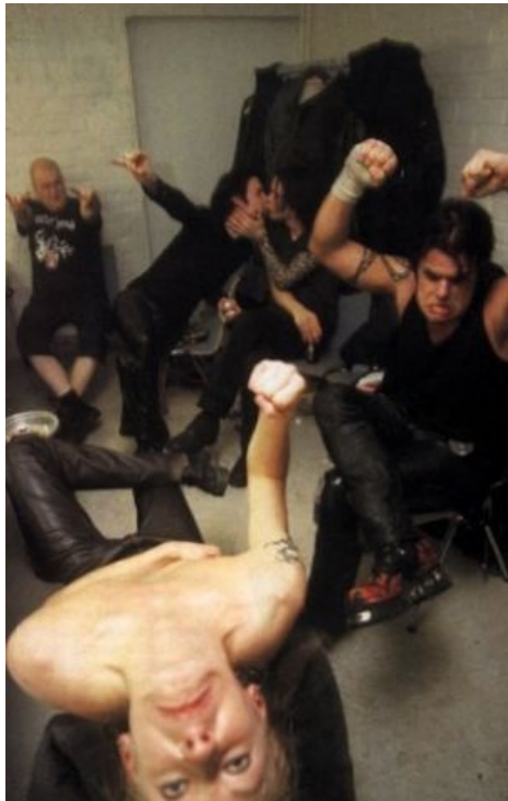
Раскрытие сути НИМ.

общественность, и банд начали тгавить (якобы за пропаганду сотонизма ). Вилле быстро переписал название под Н.И.М. и больше не пытался его расшифровать. Алсо, в Америке группа временами издавалась и гастролировала под названиями HER или — НИМ and HER, ибо на тот момент там уже наличествовала группа с названием НИМ. Правда, потом права на название были выкуплены, и все вернулось на круги своя.