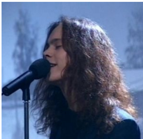
Исполнение песни «Ikku naprinsessa» (1999 г., с Agents).

Хотя продвинутые митол-фаги , готы , музыкальные критики и вообще те, у кого что-то есть в голове , относят банд к альтернативе, тысячи тринадцатилетних девочек купились на имидж группы (и самого Вилле). С тех пор именно слово «херка» символизирует любого позера от готики. Сами же химвцы решили выпендриться и окрестили свой жанр love metal , у них даже появились последователи, называющие свой стиль так же, например, To/Die/For.