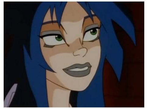
Лучший кадр в мультсериале

Вообще создатели не особо заморачивались с фамилиями, взяв наиболее распространённые . Сопоставление фактов между обоими сериалами: