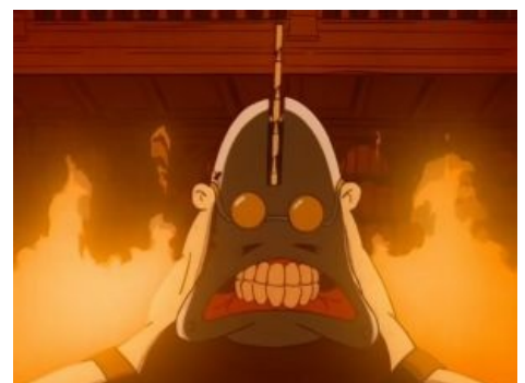
Казалось бы, при чем здесь сенобит-жиробас ?