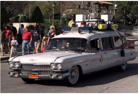
Пативэн ЕСТО-1 на марше.

ботанам наконец-то удалось отбить бабки, взять к себе раба нигру (Уинстон Зеддмор) и даже поиметь PROFIT . Это не понравилось городским чиновникам (ещё бы — не откатывают, сволочи) и охотников отправляют на принудительное лечение в местный филиал Кашценки (а до того — в РУВД, где они пугают мелких нарушителей и блюстителей закона).