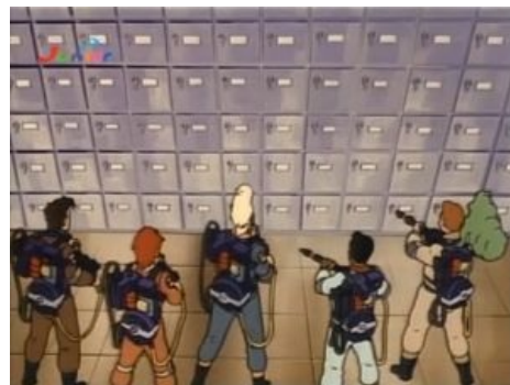
Серия, где Жаннин решила стать админом полноправным охотником за привидениями.