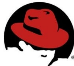
Официальное лого редхата — Shadowman

В последнее время названия дистров стали довольно странными, например, Fedora 17 называется «Beefy Miracle» (Говяжье чудо), а 18-я версия — Spherical Cow ( Сферическая корова ). Fedora 19 называется «Schrödinger’s Cat» ( Кот Шрёдингера ). Fedora 20 называется «Heisenbug». С версии 21 потеряла эту особенность, однако маскот «Говяжье чудо» в форме хот-дога до сих пор присутствует в инсталляторе и на стендах компьютерных выставок.