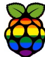
Альтернативный логотип Pidora

Проект порта на Raspberry Pi существовал довольно долгое время, но 2013-05-23 наконец форкнулся и взял себе отдельное имя. Pidora . Впрочем, над этим работают уже год , но на начало 2018 года пациент скорее мёртв, чем жив. Nuff said.