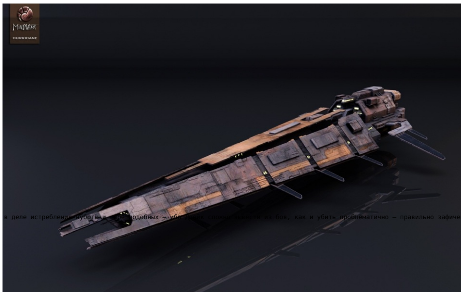
В палате мер и весов