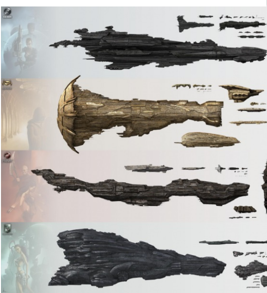
С другими кораблями