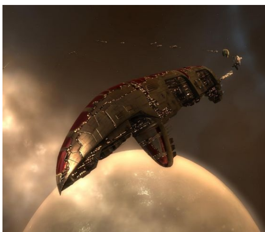
Паладин во главе каравана