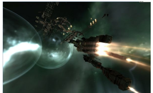
Вага уплётывает в направлении ворот

Сбалансированный и самый популярный среди новичков в пвп (да и у папок-нищобродов тоже) фрегат. Негропром. Местный зерглинг — строится пачками за минуты из говна и палок, и притом на