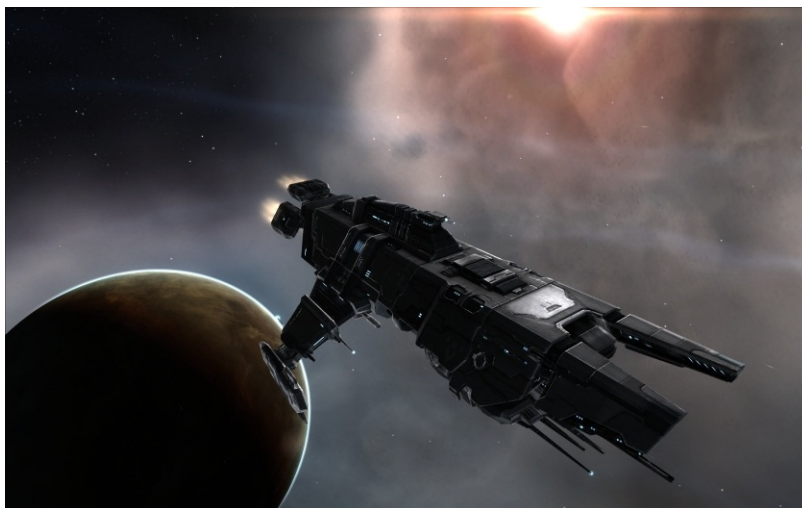
Один из вариантов Тенгу