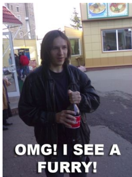
Дысы завидел фурри.