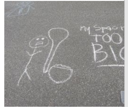
My spoon is TOO big