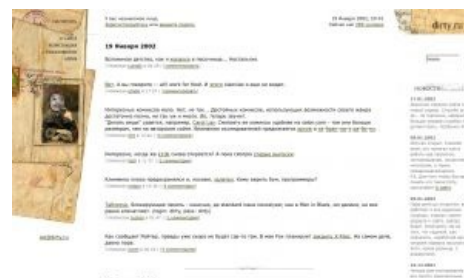
Dirty образца начала 2002 года