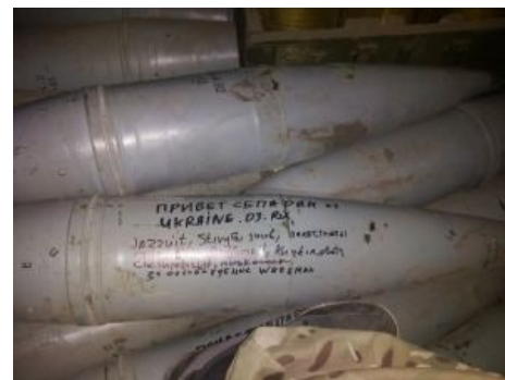
Украинские пользователи d3.ru розжигают.