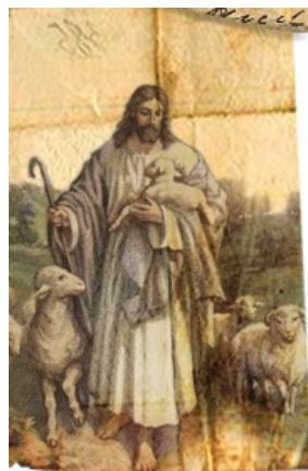
Православная гертруда православна.

« Анонимные деды Морозы ». Старое (как минимум с 2005 года) развлечение, заключающееся в рассылке новогодних подарков друг другу пользователями дёрти. Адресат выбирался из списка участников совершенно случайно. После балканизации АДМ остался на Лепре, где и проходил с переменным успехом. К новому 2011 году особо пассионарные пользователи возродили забытую традицию и на БД, на этот раз с блекджеком и гугл-картами, позволяющими оценить масштабы действия. На волне энтузиазма Дедами Морозами пожелали стать около тысячи юзеров, но конец оказался немного предсказуем : подарки в итоге отправили чуть более половины. Похожая ситуация повторилась и в следующем году, но сердца греет мысль о том, что на лепре всё ещё плачевней.