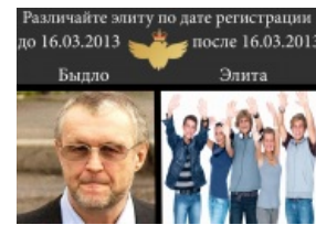
Будущее не за горами, %username%!