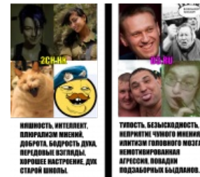
Картинка, поясняющая суть