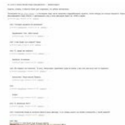
Луч смерти, посланы! Гигантский лазер в анус двошчеру!