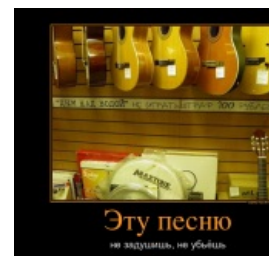
...и его Значимость™