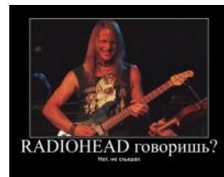
Стив Морс чему-то рад