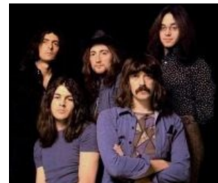
Золотой состав, одухотворённые лица

После эпичного концерта с симфоническим оркестром группа с подачи слухнувшего цеппелинца Черномора радикально меняет звук, а на смену Эвансу и Симперу приходят басист Роджер Гловер и великий Иэн Гиллан, образовав «золотой» состав, вызывающий лютый фап и пену у упоротых фанатов. Тексты становятся пособием по бухлу , ебле и рок-н-роллу , а музыка — типичным хард-роком. Пробирало и на философию, но это больше было похоже на размышления с пивком в руке, чем на вменяемые мысли. Родив винрарный альбом «In Rock» с горой Рашмор и физиономиями музыкантов, ВИА превратился в конвейер по штамповке золотых и платиновых альбомов, в числе которых был и Machine Head [1] со знаменитым «Дымом над водой». Всё бы ничего, но обухшие амбиции Черномора и заебавшие всех гастроли взяли верх, и Ричи указывает Гиллану и Гловеру на дверь.