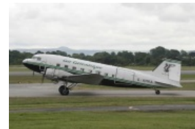
Поршневые предшественники DC-3