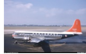
Поршневые современники. Боинг-377