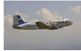
Поршневые современники. Ил-14

Инженеры, проводившие прочностные испытания при подготовке «Кометы» к производству, просто не могли предвидеть такое развитие событий: они были первыми, до того ни один пассажирский самолёт не летал на таких высотах и не испытывал таких нагрузок. Все испытания проводились по действующим тогда нормам, и даже, на всякий случай, сверх этих норм, но сами нормы оказались