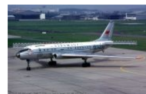
Не то, чтобы конкурент... Но он единственный из реактивных, который летал, когда «Комету» сняли с линий.

Конкуренты. Sud-Aviation «Каравелла». На заднем плане.