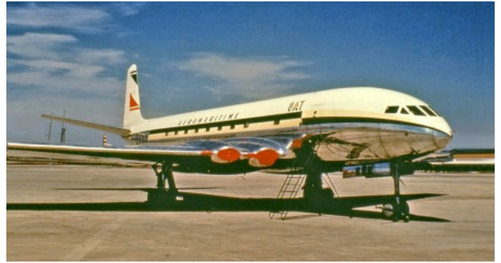
Первый в мире серийный реактивный

Собрались как-то уважаемые английские лорды и подумали: «А не запилить ли нам реактивный пассажирский самолёт?» Дело было в суровом 1942 году, и решение британцами таких сугубо гражданских вопросов могло показаться кому-то преждевременным. Война была в самом разгаре, вопрос о победителе был не решён — даже коренного перелома ещё не наступило, и уж тем паче не ясно было, где состоится суд над побеждёнными . Да и реактивных самолётов тогда ещё не было. Нет, конечно конструкторы ковали в своих подземельях и ТРД, и планеры к ним, но к тому времени ни об одном успешном взлёте известно не было, ввиду тотальной секретности подобных разработок [1] . Но чопорные англичане положили болт на эти аргументы и таки решили запилить. И оказались в итоге правы.