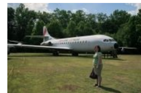
Конкуренты. Sud-Aviation «Каравелла». На заднем плане.